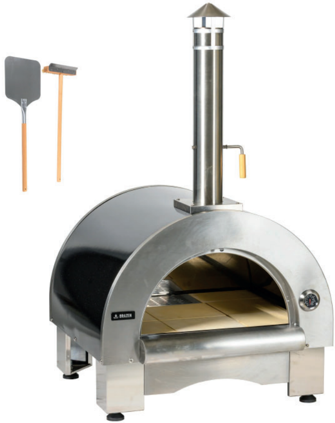
FOUR À PIZZA BOIS*