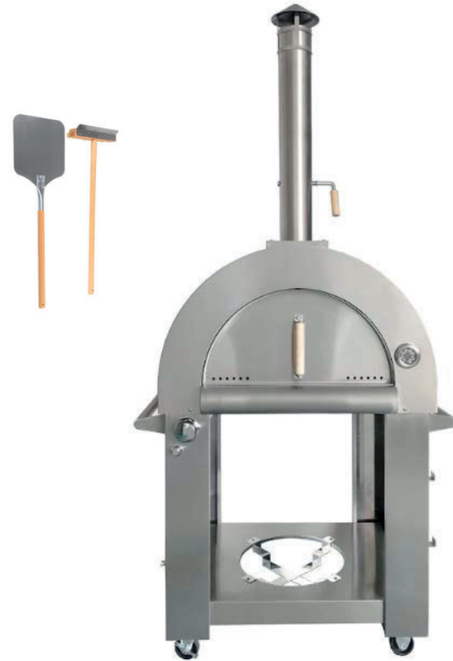
FOUR À PIZZA BOIS/GAZ*

* Compris avec : pelle à pizza, Balais/raclette Four à pizza